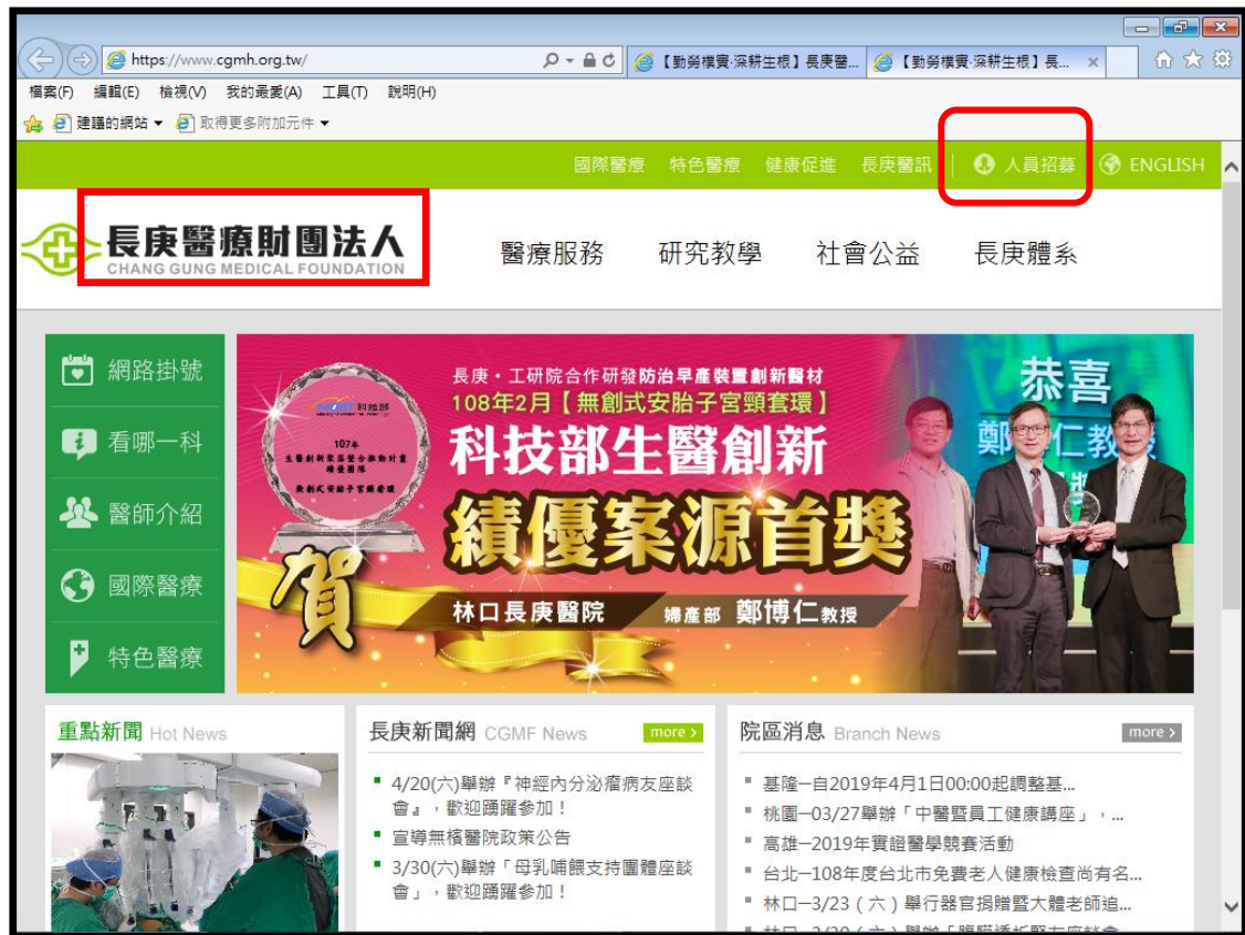
長庚醫療財團法人長庚紀念醫院官網的人員招募網頁畫面