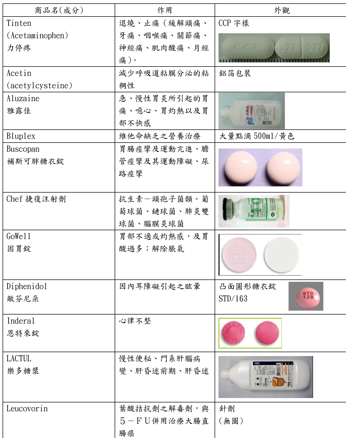
藥物作用與外觀一覽表