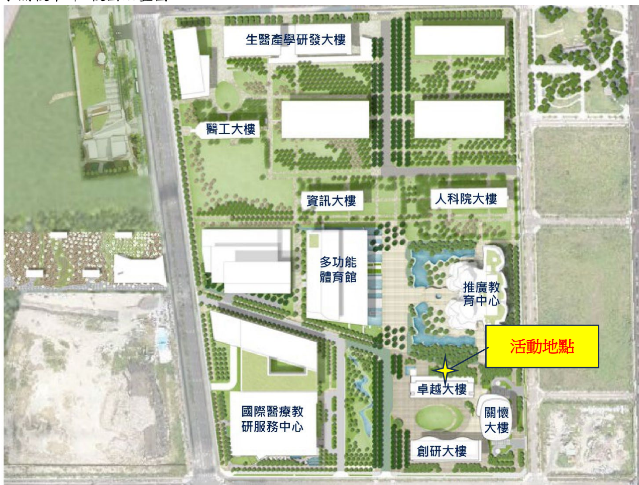
水湳校本部 校園配置圖：